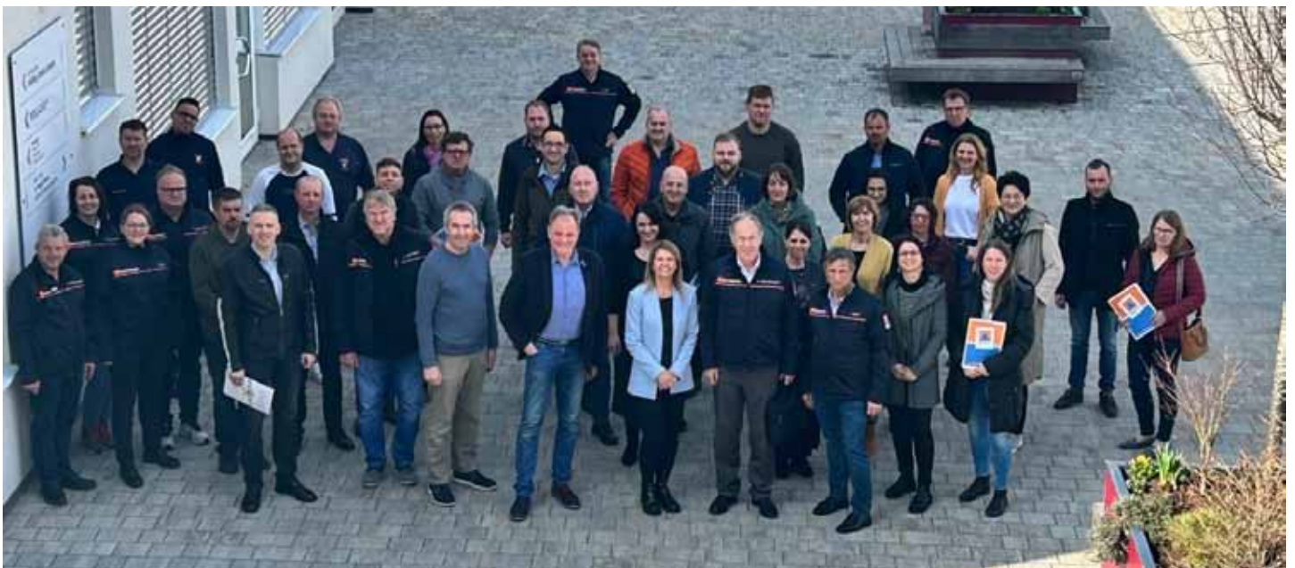
Teilnehmer:innen Schulung SKKM und Meldewesen

dewesen im Falle eines Blackouts (totaler Stromausfall) durch den Zivilschutzverband Steiermark in Söding-Sankt Johann statt.