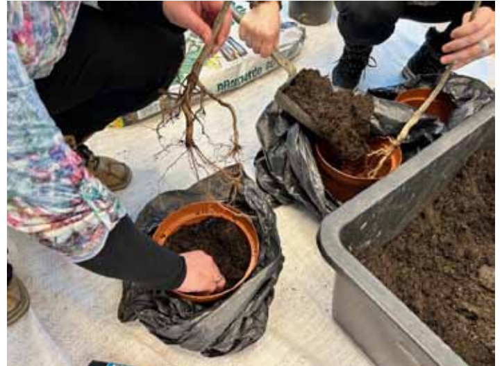
Die veredelten Obstbäumchen bleiben bis zur Ausspflanzung in Töpfen

Dazu gehörte unter anderem ein Workshop zur Winterveredlung zum Erhalt von Streuobstbäumen in Kooperation mit dem Obst- und Gartenbauverein Bezirk Voitsberg , der bereits Anfang Februar im Gemeindeamt Söding-Sankt Johann stattgefunden hat. Im Rahmen der Veranstaltung wurden theoretische Grundlagen zu Formen der Obstbaumvermehrung, Sämlingsunterlagen für Streuobstwiesen, dem Erhalt und der Vermehrung von alten Streuobstsorten durch Veredlung und Merkmalen alter Apfelsorten vermittelt. Darüber hinaus wurden Methoden der Veredlung und das erforderliche Werkzeug vorgestellt und praktisch erprobt.