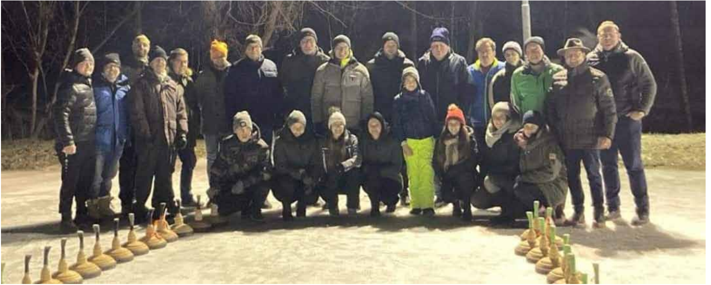
Knödelschießen bei der Wallner Mühle