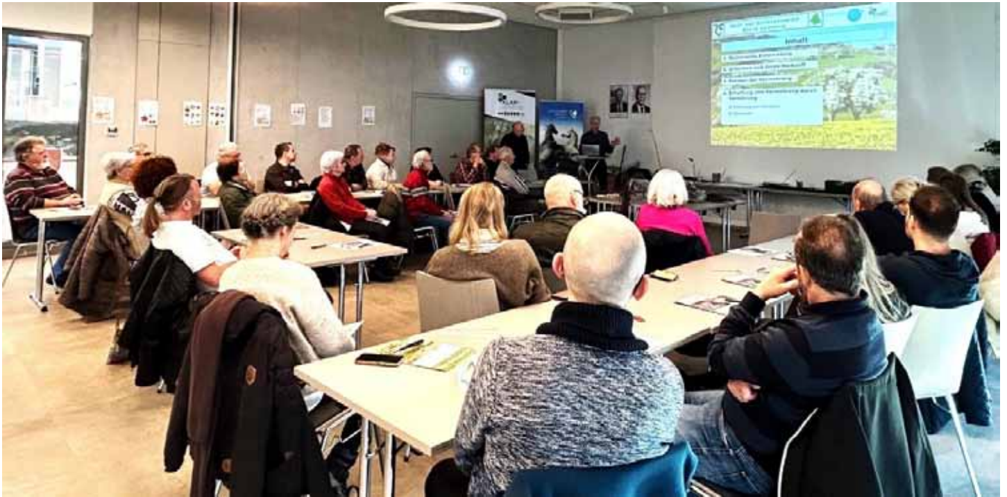
Gut besuchter Workshop zur Winterveredlung von Streuobstbäumen

Im Rahmen der Anpassungsmaßnahme werden bis Ende Mai 2024 noch weitere Veranstaltungen angeboten.