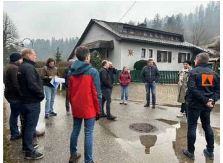
Begehung Badsiedlung Södingberg

Im Zuge der Maßnahme möchten wir unter anderem mit dem nachstehenden Infoblatt des Zivilschutzverbandes Steiermark Selbstschutzmaßnahmen bei Hochwasser vorstellen.