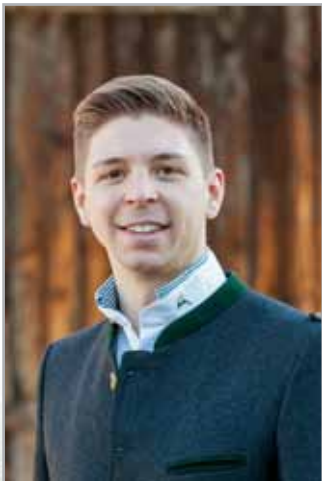
neuer Bürgermeister Lukas Vogl