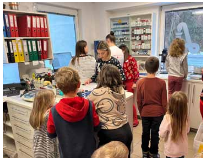
Besuch Apotheke Krems